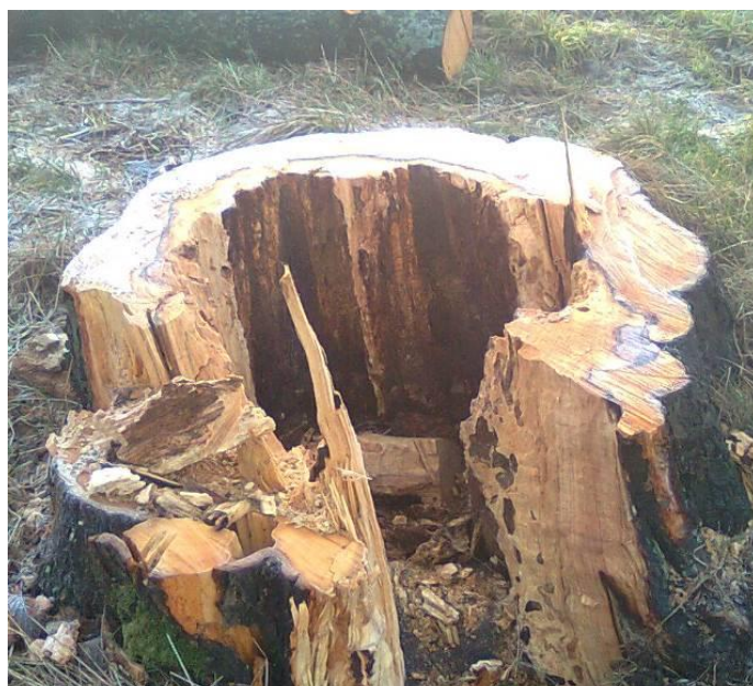
Billede 3: Hul stub efter fældning af svampeangrebet træ.

Der kommer desværre med jævne mellemrum nye historier om sygdomme, man som ansvarlig for risikotræer skal være opmærksom på. Park & Vejs træmænd følger med i ny viden via fagblade, netværk og kurser.