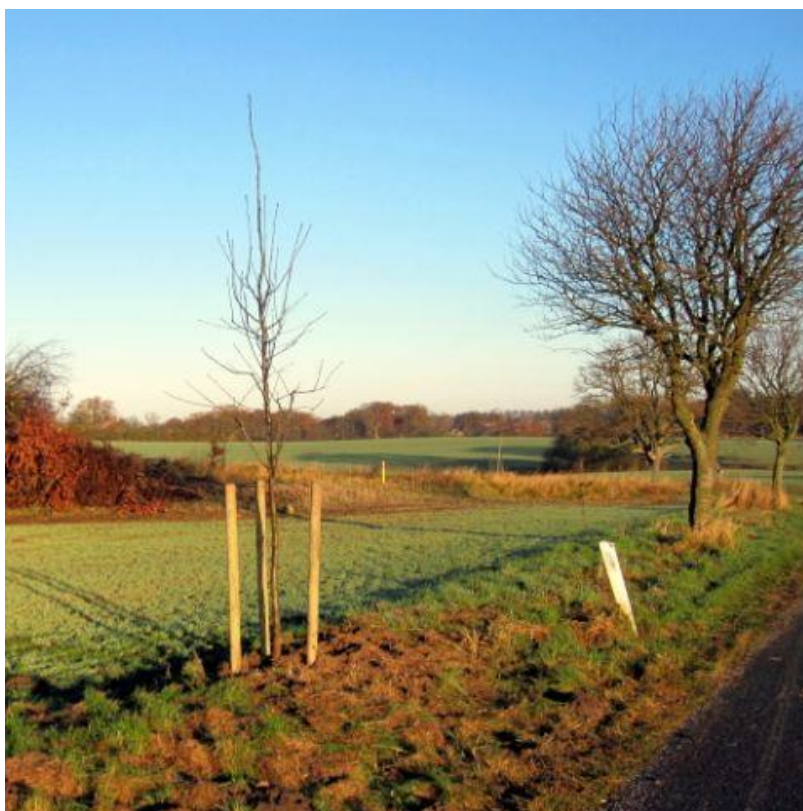
Billede 2: Nyt og gammelt træ på Gisselfeldvej

Der kan være en meget stor landskabsmæssig virkning af et enkelt træ eller en mindre trægruppe med en markant placering på åbne marker, i vejkanten eller f.eks. til at markere en sidevej. Rødbøgene ved broen på Villa Galinavej er et fantastisk eksempel.