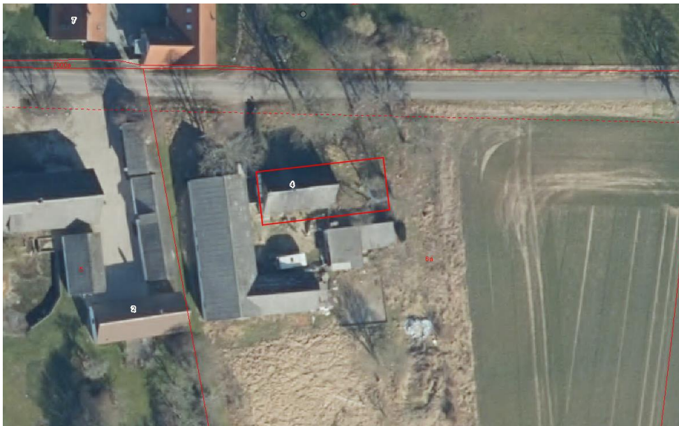
Kort 3 - Omtrentlig placering af det nye hus med rød rektangel, med ortofoto