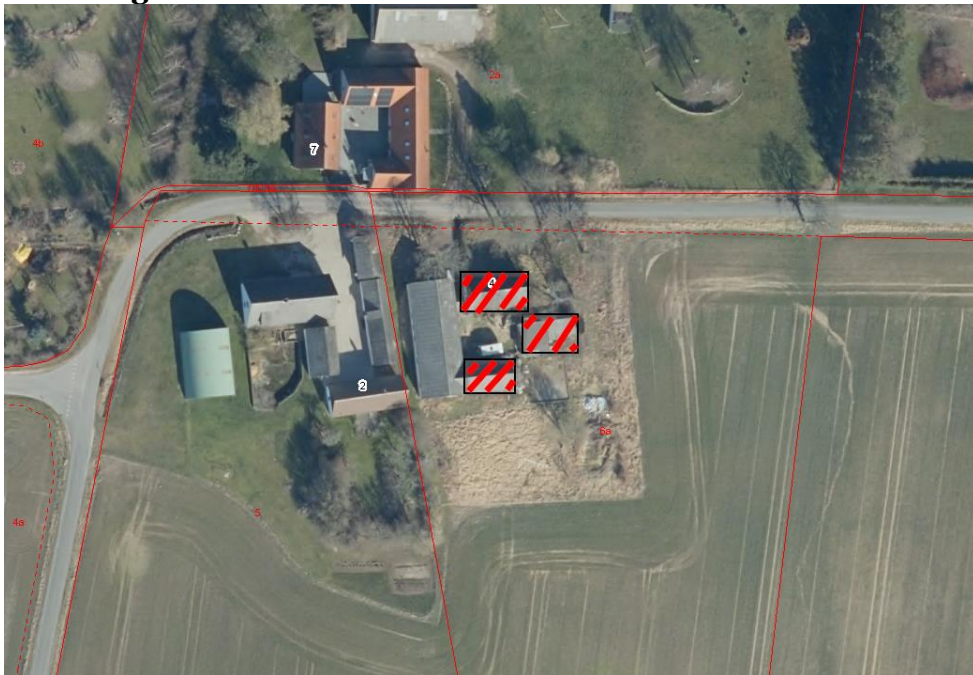
Kort 1 - De bygninger der rives ned markeret med sorte bokse med rød skravering