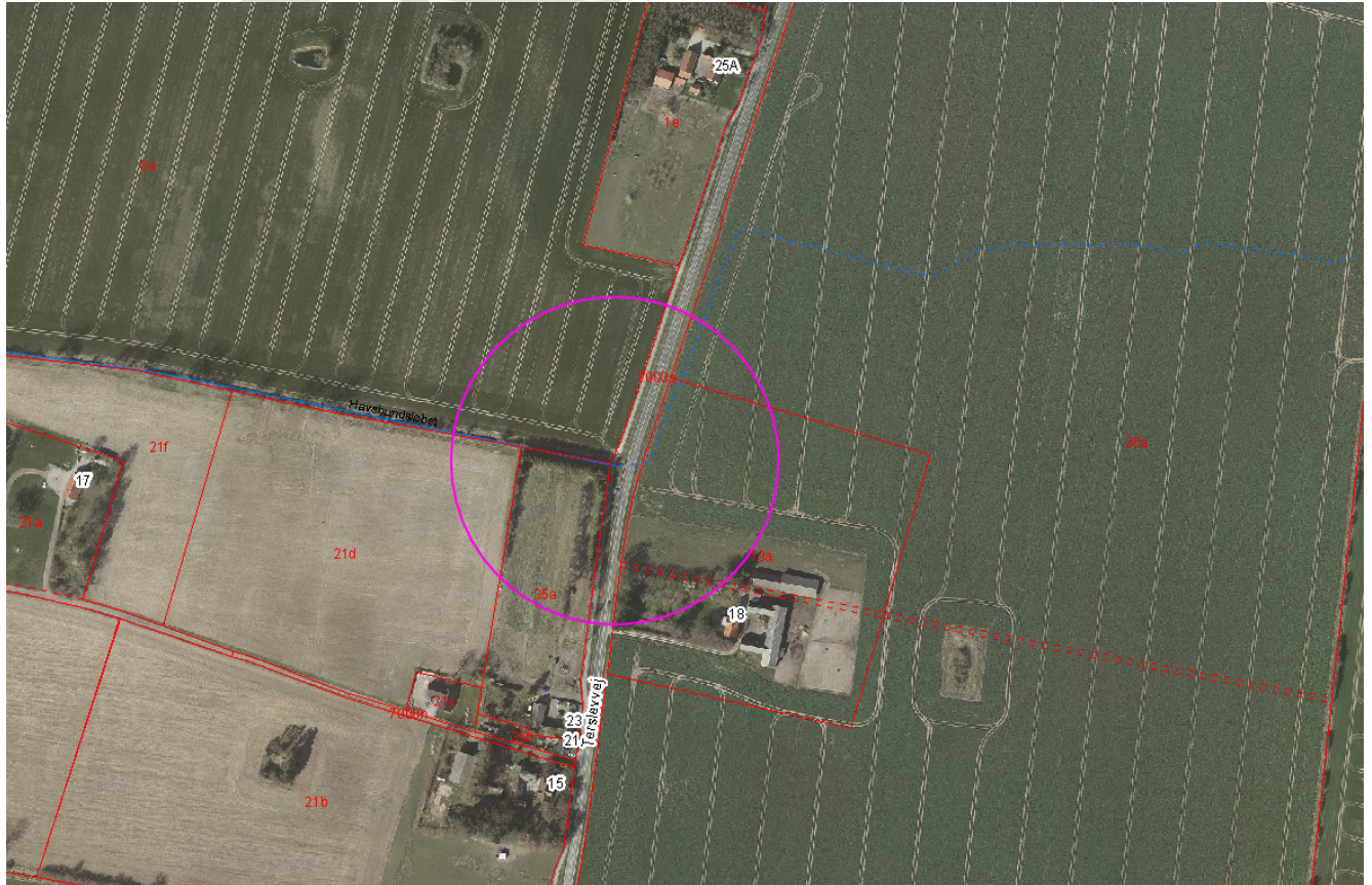
Luftfoto. Pink cirkel viser projektområdet.