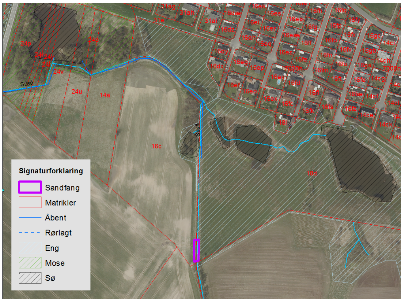
Kort 1. Oversigtskort over projektområdet.