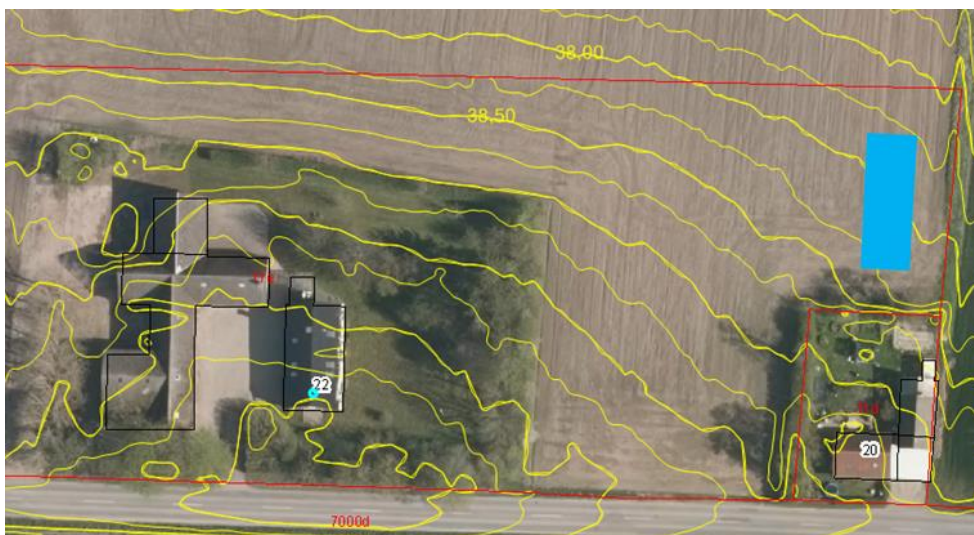
Kort 1 – Kortet viser bygningerne på ejendommen Teestrupvej 22 til venstre og Teestrupvej 20 til højre. Med blå er vist den første ansøgte placering til pilerensningsanlægget.

Anlægget blev oprindeligt ansøgt med en placering nær det nordlige skel på naboejendommen Teestrupvej 20. Denne placering blev ansøgt med baggrund i, at der skulle skabes bedst mulige arronderingsforhold på marken og at anlægget skal placeres lavere i terrænen end ejendommens bygninger, hvorfor det skal ligge øst for bygningerne. Den tidligere ansøgte placering kan ses på kort 1.