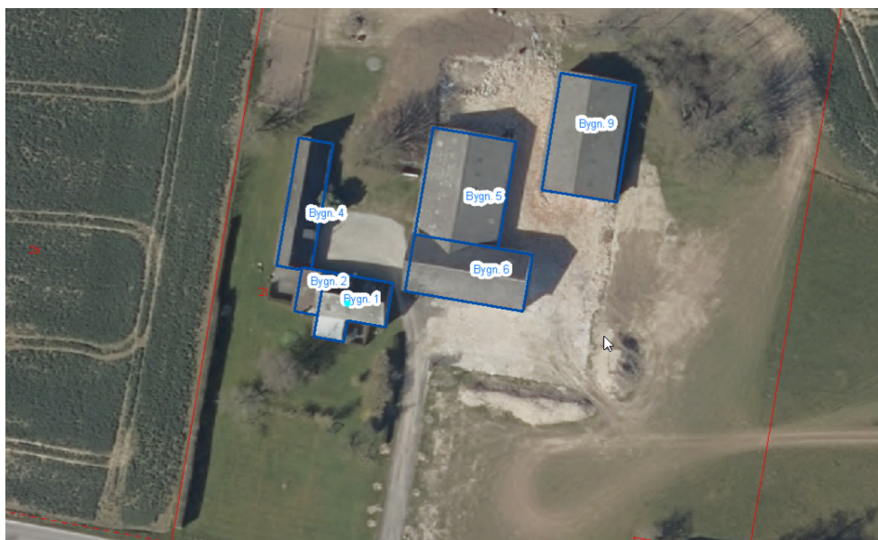
Oversigtskort 1: viser placeringen af bygninger på grunden. Ansøgte ejendom er bygning nr. 6.

Ejendommen ligger i et område der i Faxe Kommuneplan 2021 er udpeget som: