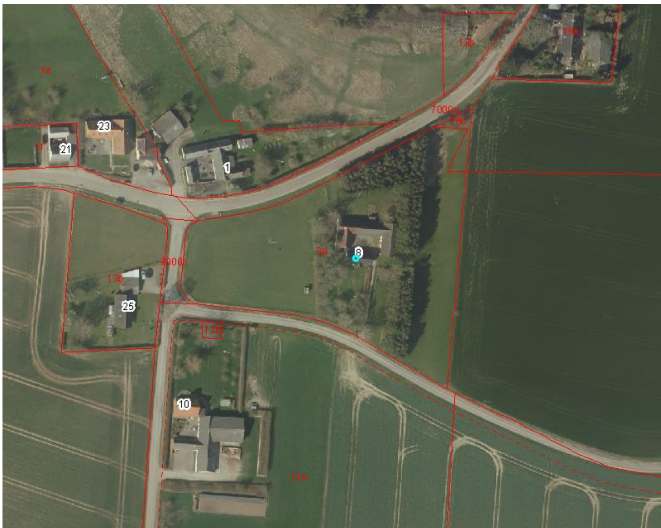
Kort 2: Skuderupvej 8, luffoto

Ejendommen ligger i et område der i Faxe Kommuneplan 2013 er udpeget som særligt værdifuldt landbrugsområde.