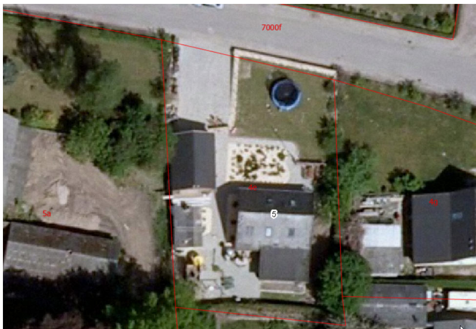
Figur 1: Luftfoto fra 2008

I har ansøgt om lovliggørelse af en kombineret carport/udhus. Baseret på luftfotos er bygningen bygget i to omgange. Garagen ses første gang på luftfotos i 2008. I 2010 ses fyrrumet og skuret på luftfotos. Garagen og fyrrum/skur fremstår som en samlet bygning med skråtag. Bygningen er lavet i mursten og tagbeklædningen er i betontegl. Bygningen er 15 m x 5,30 m og 4 m på det højeste sted.