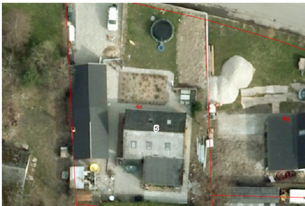
Figur 2: Luftfoto fra 2010