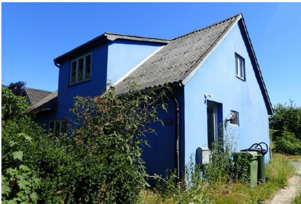
Foto af det nu nedrevne hus på Nordhøjvej 16

Nedenfor ses billeder af huset før det blev revet ned og ejendommens placering i landsbyen.