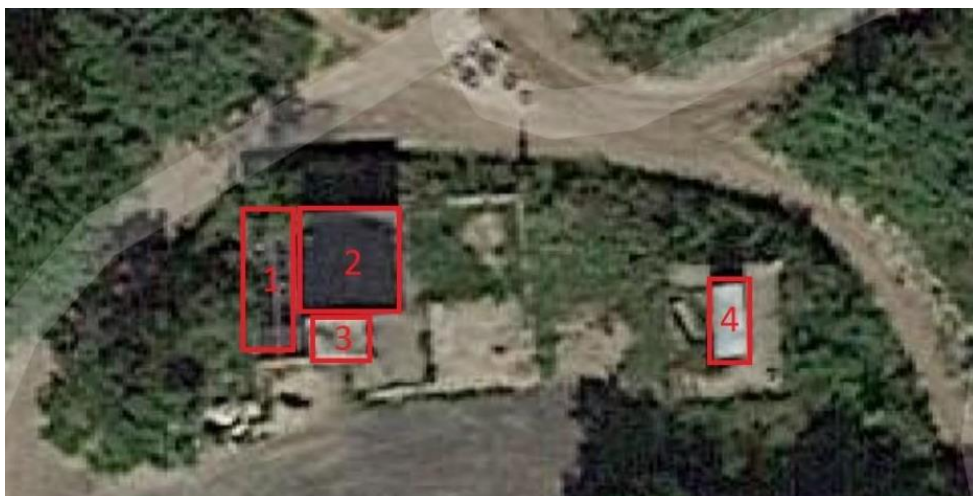
Kort 3 – Placering af bygningerne på ejendommen.

Ved banen er der opstillet et par containere, der indeholder en traktor, olie og diesel til traktoren, river, skovle og lignende. Derudover er der lavet en overdækning i træ og metalplader, samt opstillet et buskur som siddeplads for tilskuere. Bygningerne er beskrevet i nedenstående skema og deres placering er vist på nedenstående kort: