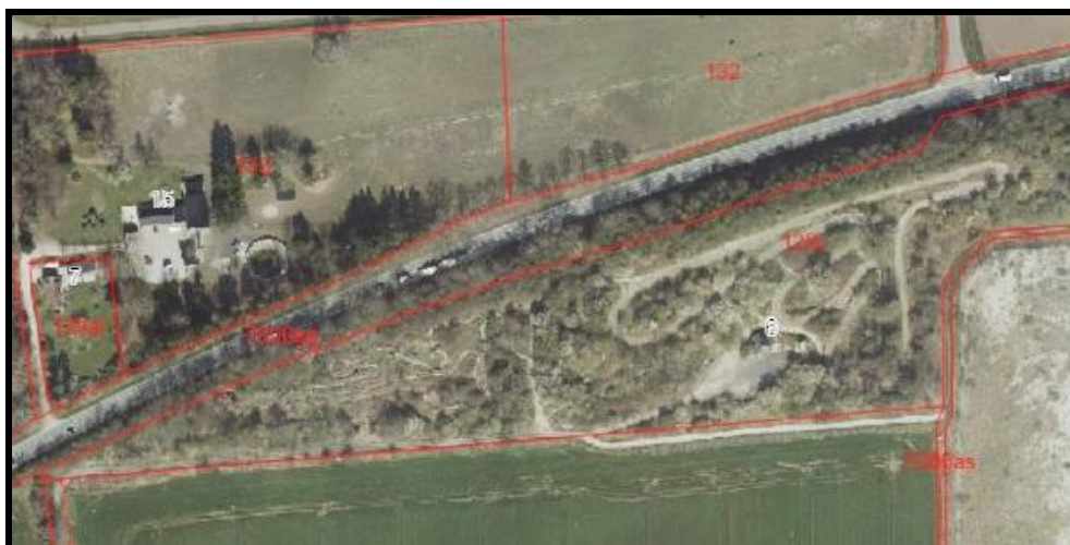
Kort 1 - Oversigt over baneområdet.

Banen består i dag af en motocrossbane, der har ligget der i mange år, samt en nyere endurobane. Enduro er en langdistance motorcykelsport, hvor der køres på en "off road" bane med forskellige forhindringer. I et enduroløb handler det om at køre så mange omgange som muligt indenfor en tidsramme på 2 - 3 timer. Enduro larmer mindre end motocross, da der bl.a. køres langsommere på banerne og det er baner med forhindringer. Sporet på endurobanen har en længde på ca. 1.065 m, mens sporet på motocrossbanen har en længde på ca. 629 m. Banens udstrækning kan ses på kort 1 og 2.