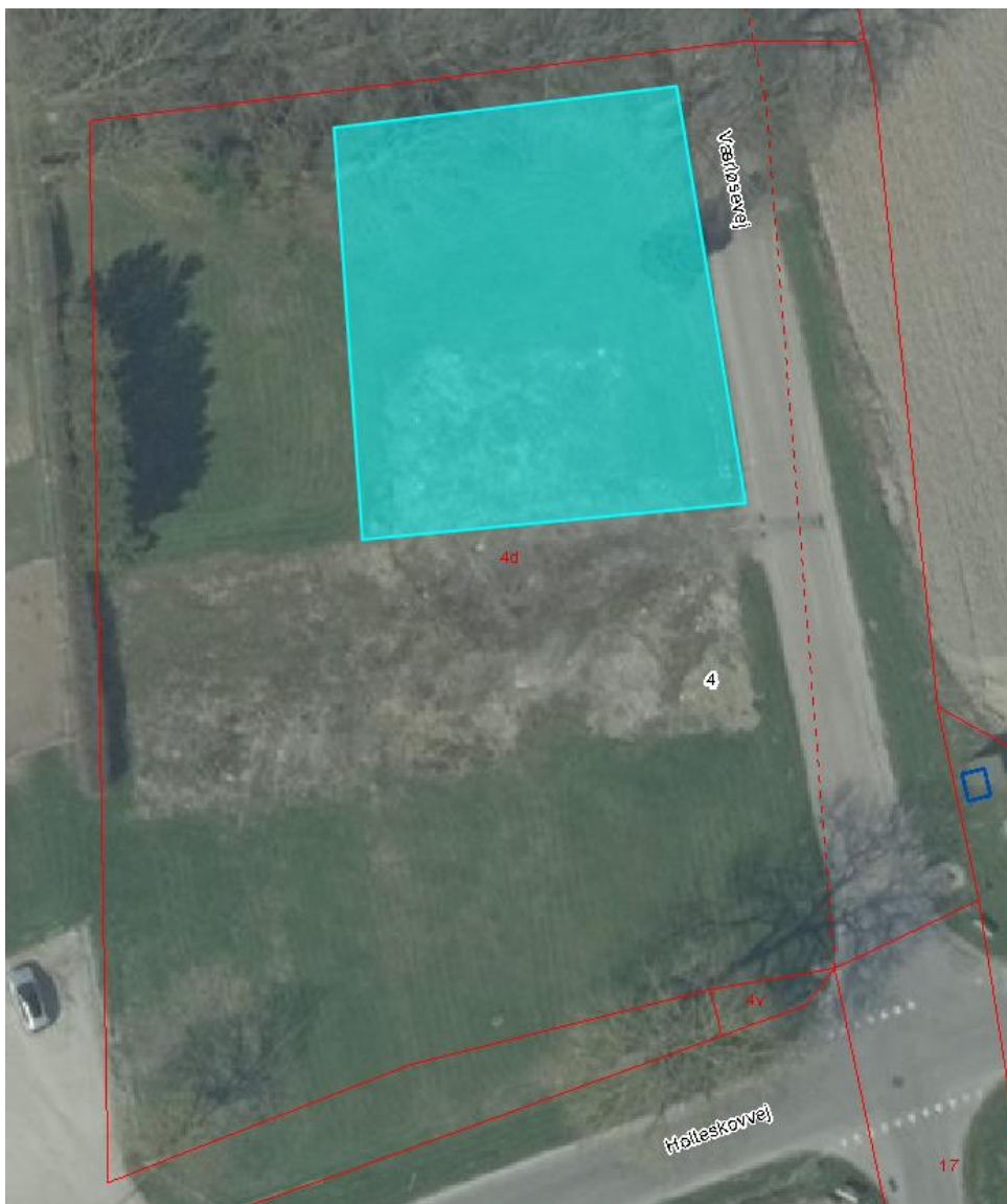
Kort 2 – Byggefeltet for et nyt hus er vist med en lyseblå firkant.

Ejendommen ligger i kanten af landsbyen Ebbeskov øst for Faxe By. I kommunens landsbyanalyse for Ebbeskov står blandt andet følgende: