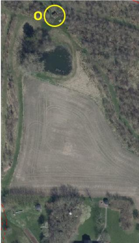
Kort 2 – Kortet viser placeringen af shelter 2, som er placeret i skoven cirka 200 meter nord for ejendommens stuehus