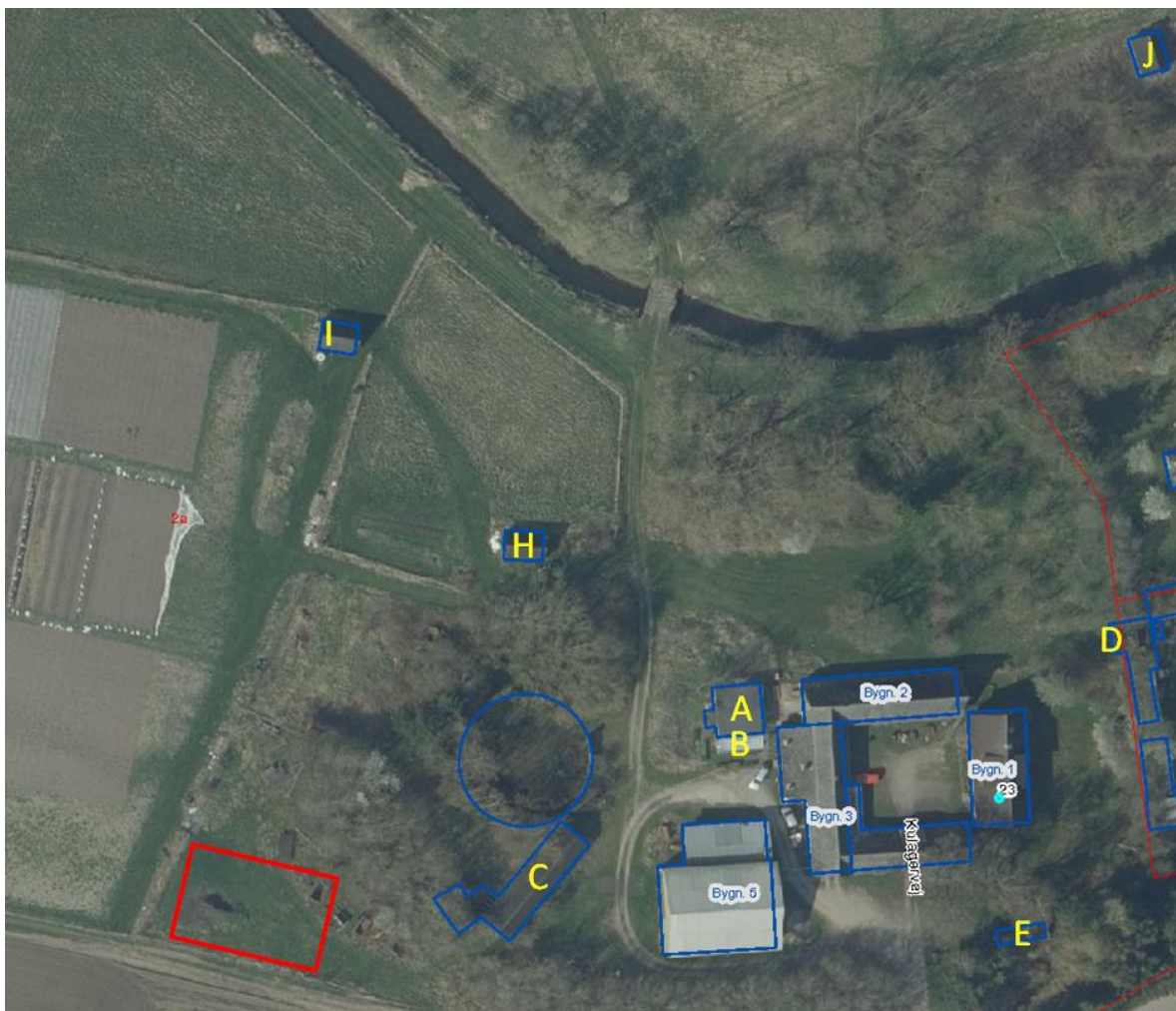
Kort 1 – Kortet viser ejendommens bygninger 1 – 5, som allerede er registreret i BBR, samt placeringen af det ansøgte drivhus (Rød firkant) og bygningerne A-E samt H-J, der lovliggøres med denne tilladelse. Bygningerne F, G og K ses på kort 2.

Placeringen af ejendommens nuværende bygninger og det ansøgte drivhus kan ses på kort 1 og kort 2.