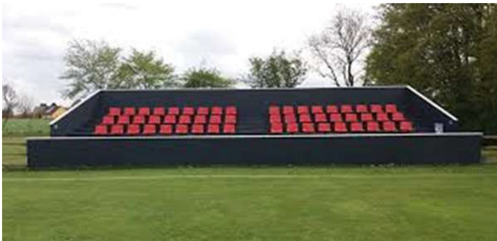
Figur 4: Ansøger ønsker en tribune, som minder om Gørslevs tribune. Billedet viser Gørslevs tribune.

Konstruktion lukkes med malede vandfaste plader, og eternitplanker helt ned til græs, for at gøre græsklipning nemmest mulig.