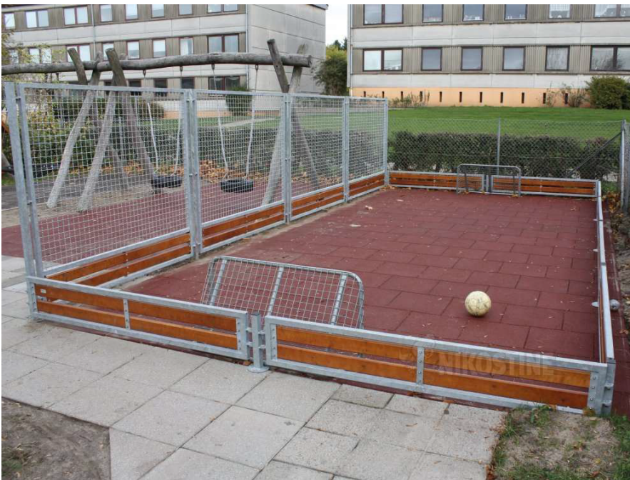
Figur 3: ansøgers medsendte visualisering af boldburet

Boldburet er tiltænkt mindre børn, som er med til kampe. Børnene befinder sig derved i nærheden af klubhus, toiletfaciliteter og forældre. Større børn henvises til streetfodboldbanen, som ligger ca. 70 m fra nærmest nabo. Der vil ikke blive afviklet faste spil eller faste aktiviteter på denne bane. Banen opbygges med faldunderlag og evt. afvanding til faskine. Dette afklares efter denne tilladelse, og vil muligvis kræve en nedsivningstilladelse. På nedenstående billede kan man se, ansøger medsendte visualisering af boldburet.