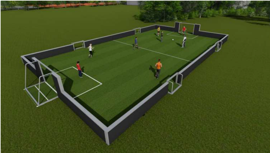
Figur 2: ansøgers medsendte illustration for principopbygning af multibanen.