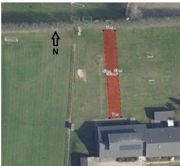
Figur 5: Med rødt er vist placeringen af overskudsjord

Ved anlæg af streetfodboldbanen vil der komme ca. 55 m 3 overskudsjord. Dette placeres langs eksisterende stigning i terrænet i vestlig retning. Jorden placeres i et lag af 10-15 cm og vil herefter blive tilsået med græs, så det naturligt falder ind i området. På nedenstående kort ses udlægget af jord.