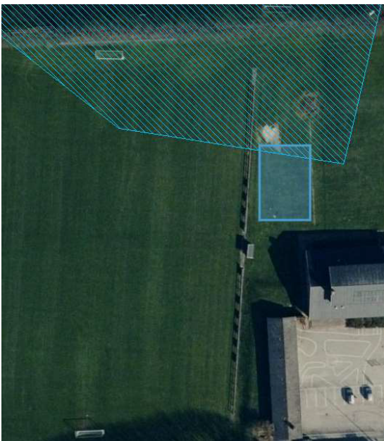
Figur 7: En lille del af streetfodboldbanen ligger inden for fredningen

Ejendommen dækkes af en tinglyst kirkefredning, som vist på figur 7. Fredningen omhandler bygninger og højstammede træer. Den nordligste del af streetfodboldbanen og en del af jordvolden ligger inden for fredningen.