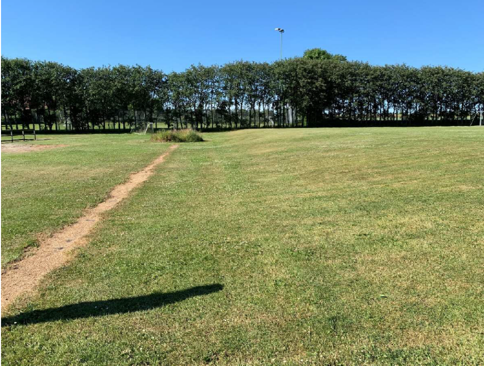
Figur 6: eksisterende terrænstigning. Overskudsjoeden placeres på bakken, som derved forskydes en smule mod vest. På billedet vil forskydningen ses mod venstre