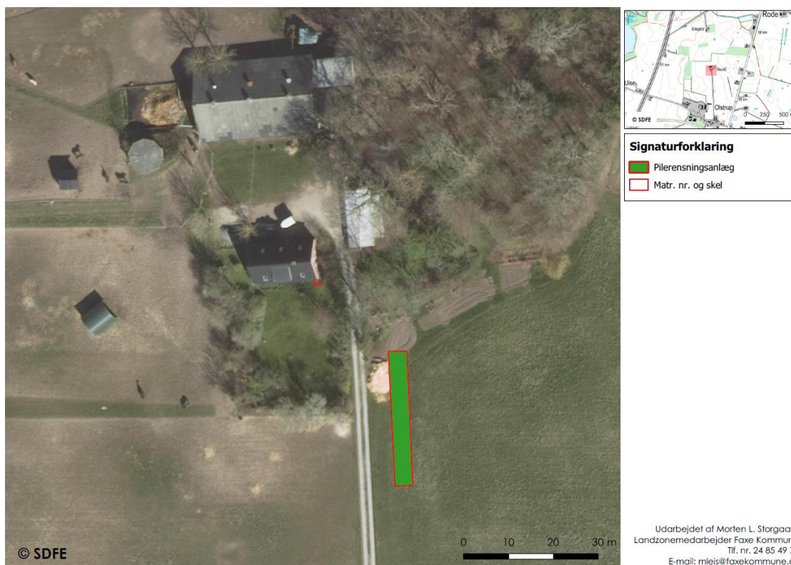
Kort 1: Oversigtskort over ejendommen med indtegning af pilerensningsanlæggets omtrentlige placering og størrelse