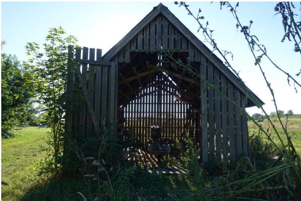
Den nuværende udformning af hønsehusene.

Der er et toilet med adgangsdør fra gårdspladsen på gården, som vil skulle bruges i forbindelse med overnatning i shelterne i de gamle hønsehuse.