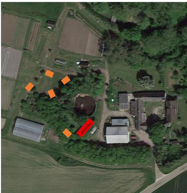
Kort 2 og 3 – mulige placeringer af hønsehusene, når de skal indrettes til shelters, er vist med orange. Med rødt er vist et stort hønsehus, som ikke inddrages i projektet.