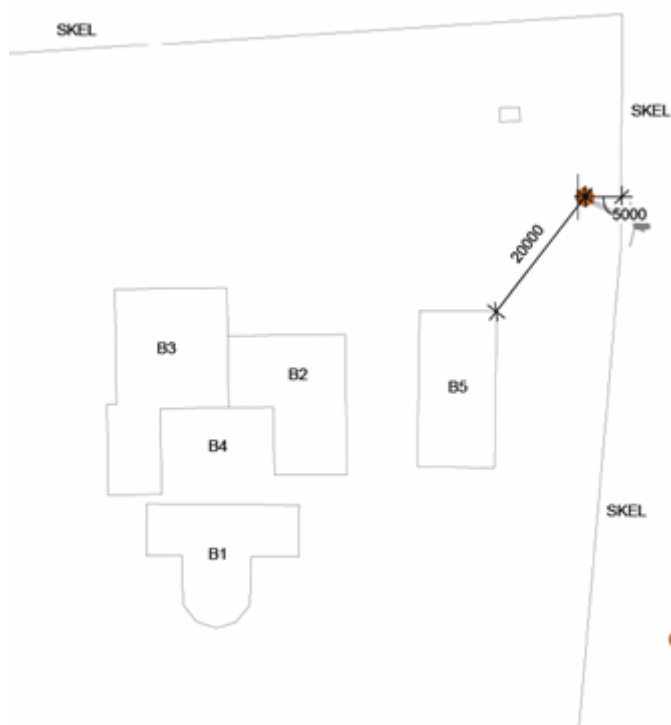
Figur 1 (øverst) og 2 venstre):

1: situationsplan over ejendommen. Faxe Kalkbrud og Østbanen ses vest for ejendommen. 2: Placeringen af møllen i forhold til ejendommens bygninger ses markeret med rød prik.