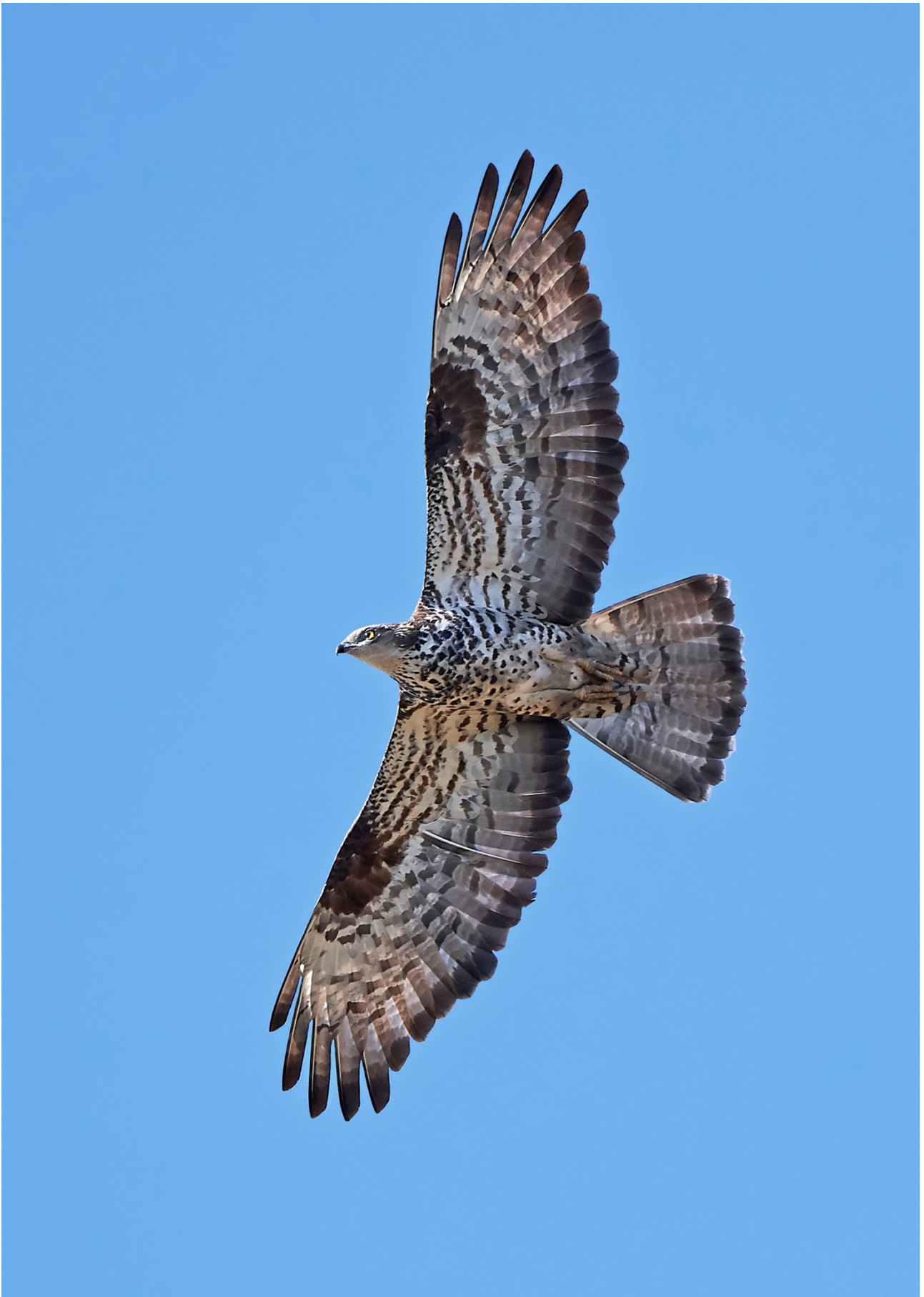
Hvepsevåge er på udpegningsgrundlaget for Natura 2000-området.