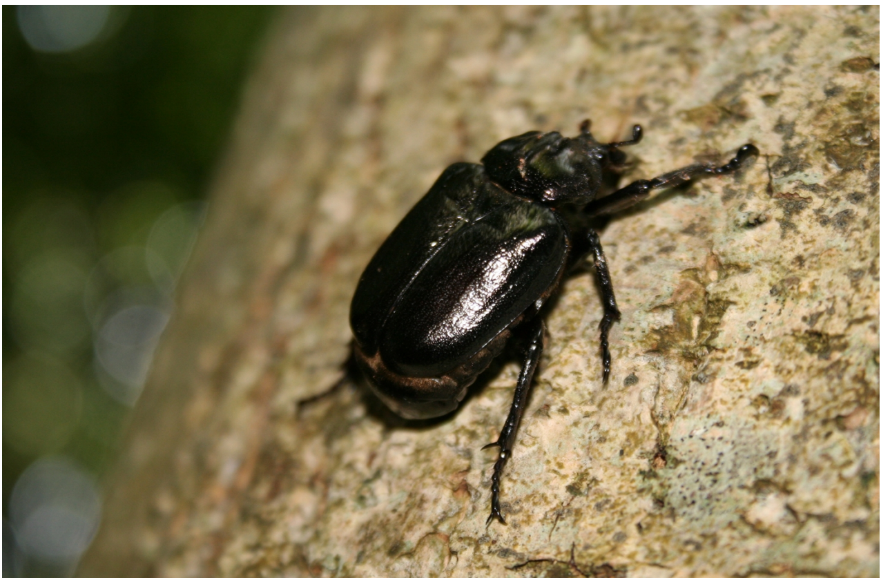
Eremit er på udpegningsgrundlaget for Natura 2000-området.