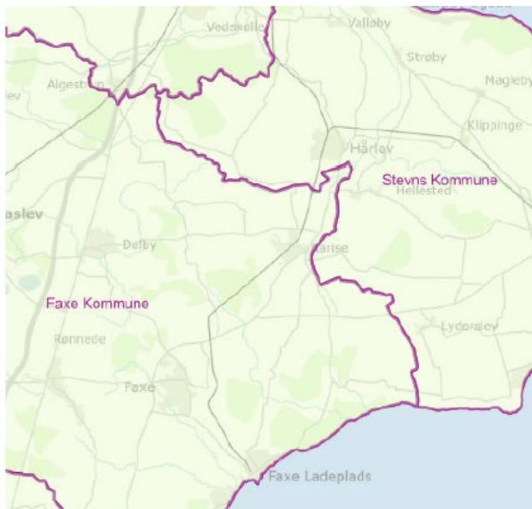
Figur 1: Det fremgår, at banestrækningen mellem Hårlev og Faxe Ladeplads ligger i både Stevns og Faxe Kommune.

På vegne af Lokaltog ansøges hermed om tilladelse til at overskride de tilladte støjgrænser og de tilladte tidspunkter for støjende arbejder i forbindelse med gennemførelsen af nogle af anlægsarbejderne.