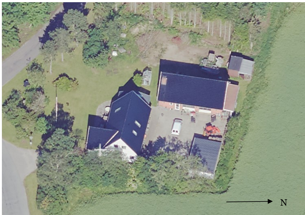
Figur 1: Skråfoto af ejendommen. Nord er mod højre på fotoet. Høns huset ligger længst mod øverste højre hjørne. Brændeskuret er bygget på værkstedsbygningen

I forlængelse af en udhusbygning, er der bygget et brændeskur på 16 m 2 . Brændeskuret måler 8 m x 2 m, og er 2,4 m højt. Brændeskuret er åbent og har en brædebeklædning med afstand mellem brædderne. Taget er af blik.