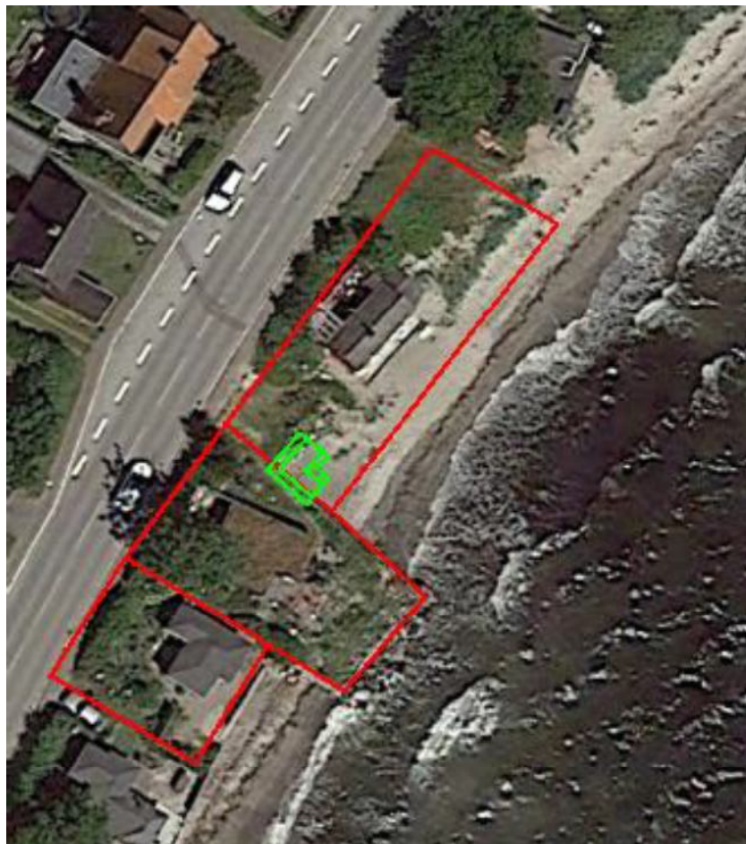
Figur 3.4 Placering af skråningsbeskyttelse på matriklerne