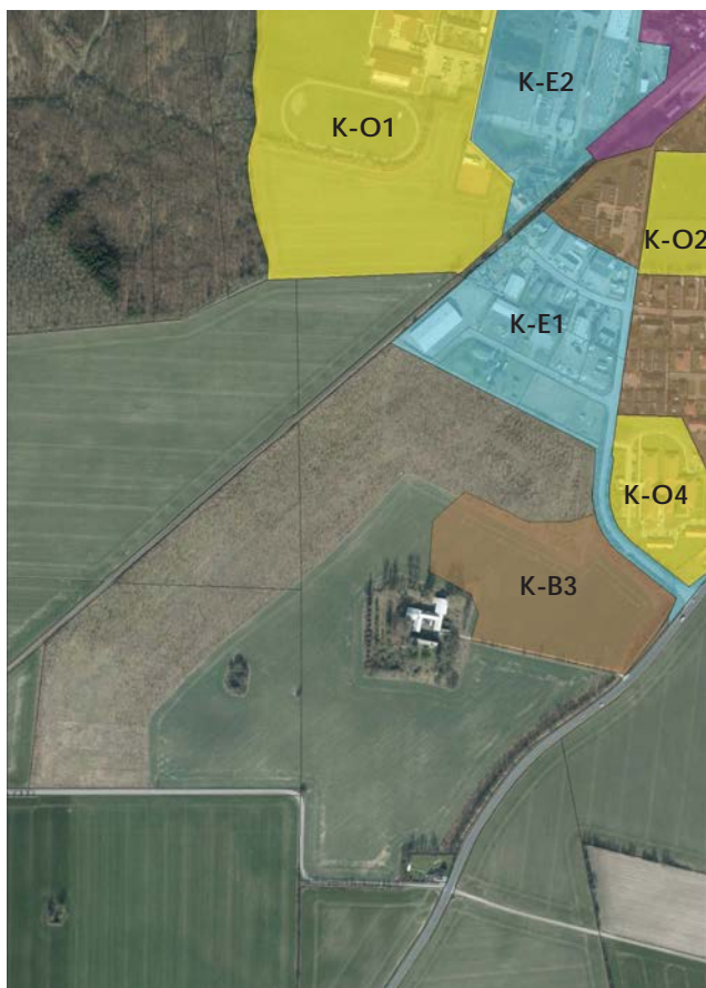
Tillæg nr. 3