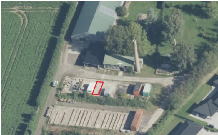
Figur 1: Luftfoto af ejendommen. Rød markering viser tankens placering.

Tanken vil blive etableret i overensstemmelse med retningslinjerne i BEK. 1444 af 15/12/2010, herunder krav om afstand til nærmeste bygning og skel. På figur 1 ses tankens placering markeret med rødt.