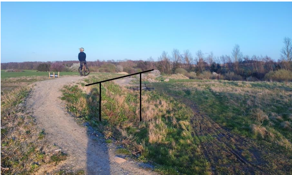
Figur 1 - Skitse af læskuret, som bygges ind i startbakken

Det vil være lukket på siden ind imod bakken, og på den østlige side.