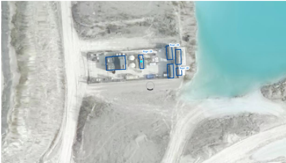
Figur 2 - Viser placeringen af de eksisterende testfaciliteter.

Anlæggets primære funktion vil fortsat være afprøvning af raketmotorer. Der er således ikke tale om sprængninger, men om motortest.