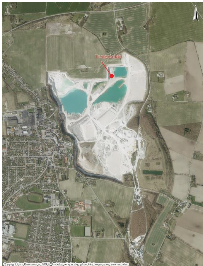
Figur 1 - Oversigtskort med testområdets placering markeret med rødt

Det er for, at Orbex midlertidigt kan fortsætte deres lovlige anvendelse af testfaciliteterne alt imens det vurderes, om der kan tillades en udvidelse, eller om der er andre dele af projektet der skal tilrettes.