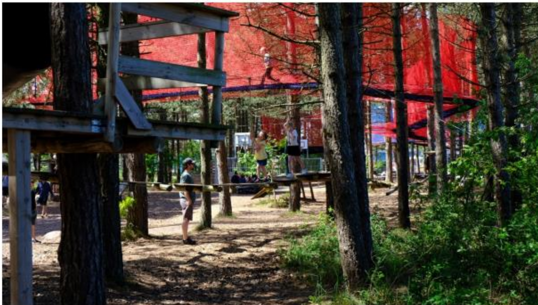
Foto fra terræn viser junglesti ophængt i træerne syd for den tidligere parkeringsplads.