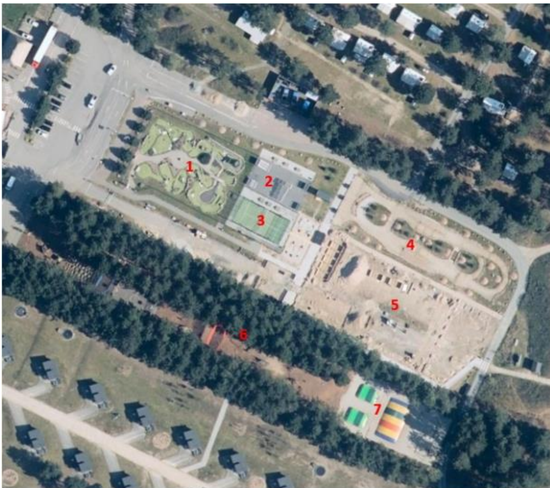
Foto fra 2023 viser minigolfbanen (1). Der er desuden anlagt skaterbane (2), padeltennisbane (3), bane for elbiler (4) og legeområde med fodboldbane, beachvolley, kælezoo mm (5), junglesti i træerne (6) og placeret hoppepuder mm. (7). Nord for projektområdet er der campingareal, og syd for projektområdet er der campinghytter.

Figur 1 - Udklip fra Kystdirektoratets afgørelse