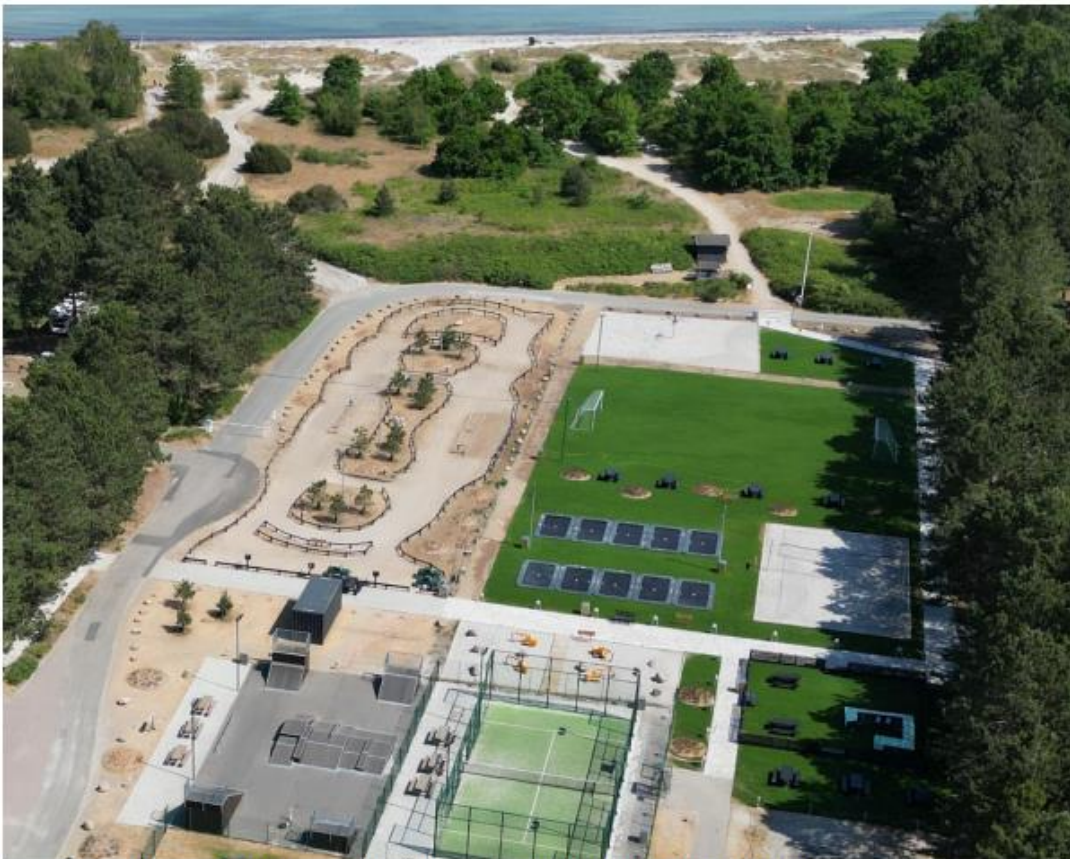
Foto fra vest viser padelbane, skaterbane, kæle zoo, beachvolley, trampoliner, fodboldbane, bane for elbiler m.m. Bygningerne længst mod øst, søværts vejen, er fjernet.