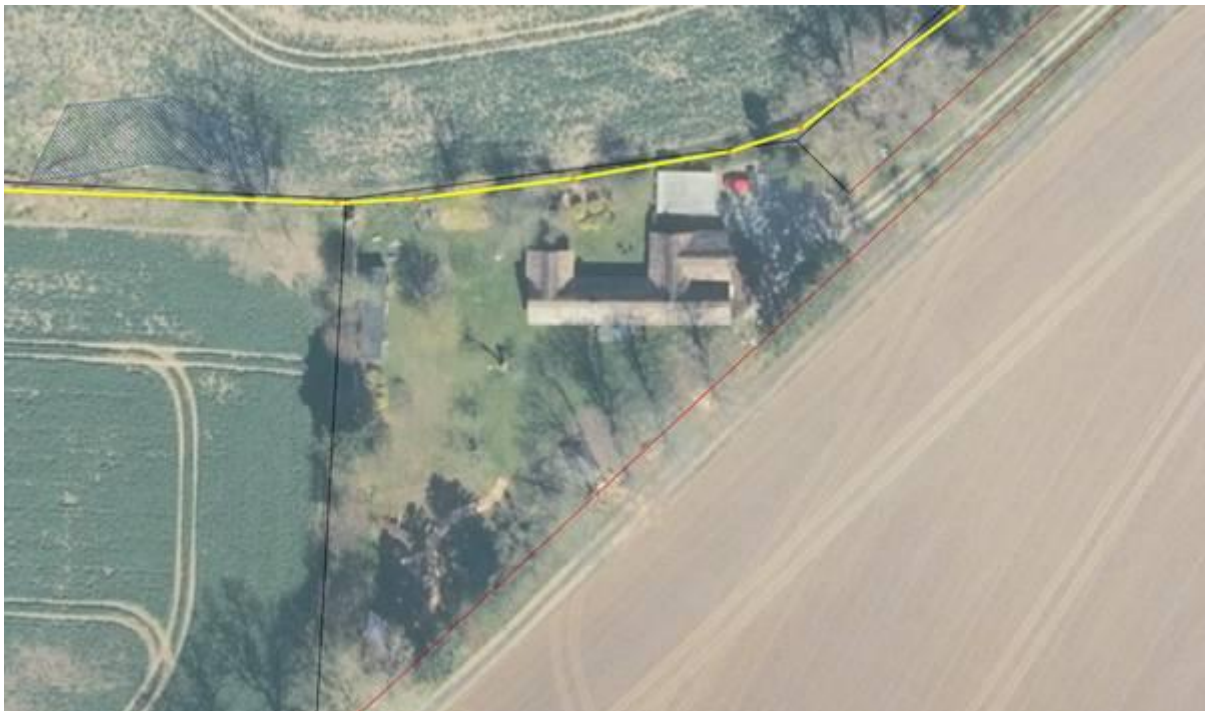
Figur 2 - Ny registrering af digets placering

Faxe Kommune har vurderet, at projektet ikke vil påvirke Natura 2000 områder væsentligt, og at det ikke kan påvirke yngle- eller rasteområder for arter på habitatdirektivets bilag IV samt plantearter på samme bilag.