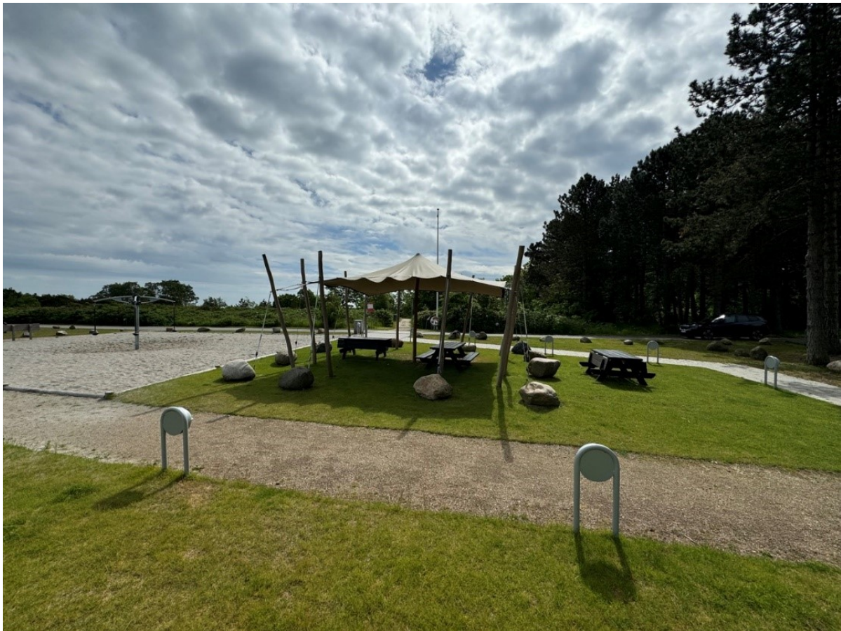
Foto af arealet længst mod øst, hvor der er opsat solsejl og andre effekter, som vist på fotoet.