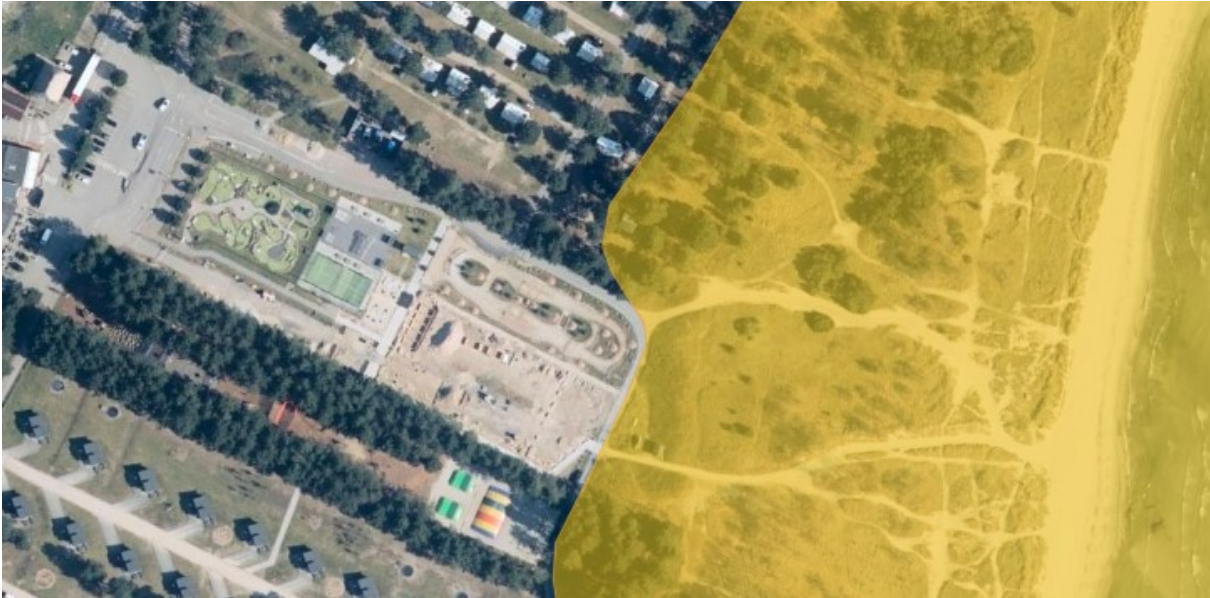
Figuren viser afgrænsningen af Natura 2000-området (gul markering) ved projektområdet.

Udpegningsgrundlaget for Natura 2000-området ses i bilag 3.