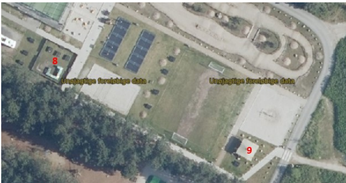
Foto fra 2024 viser placering af kælezoo (8) og solsejl (9). Billedet viser også, at bygningerne længst mod øst, søværts vejen, er fjernet