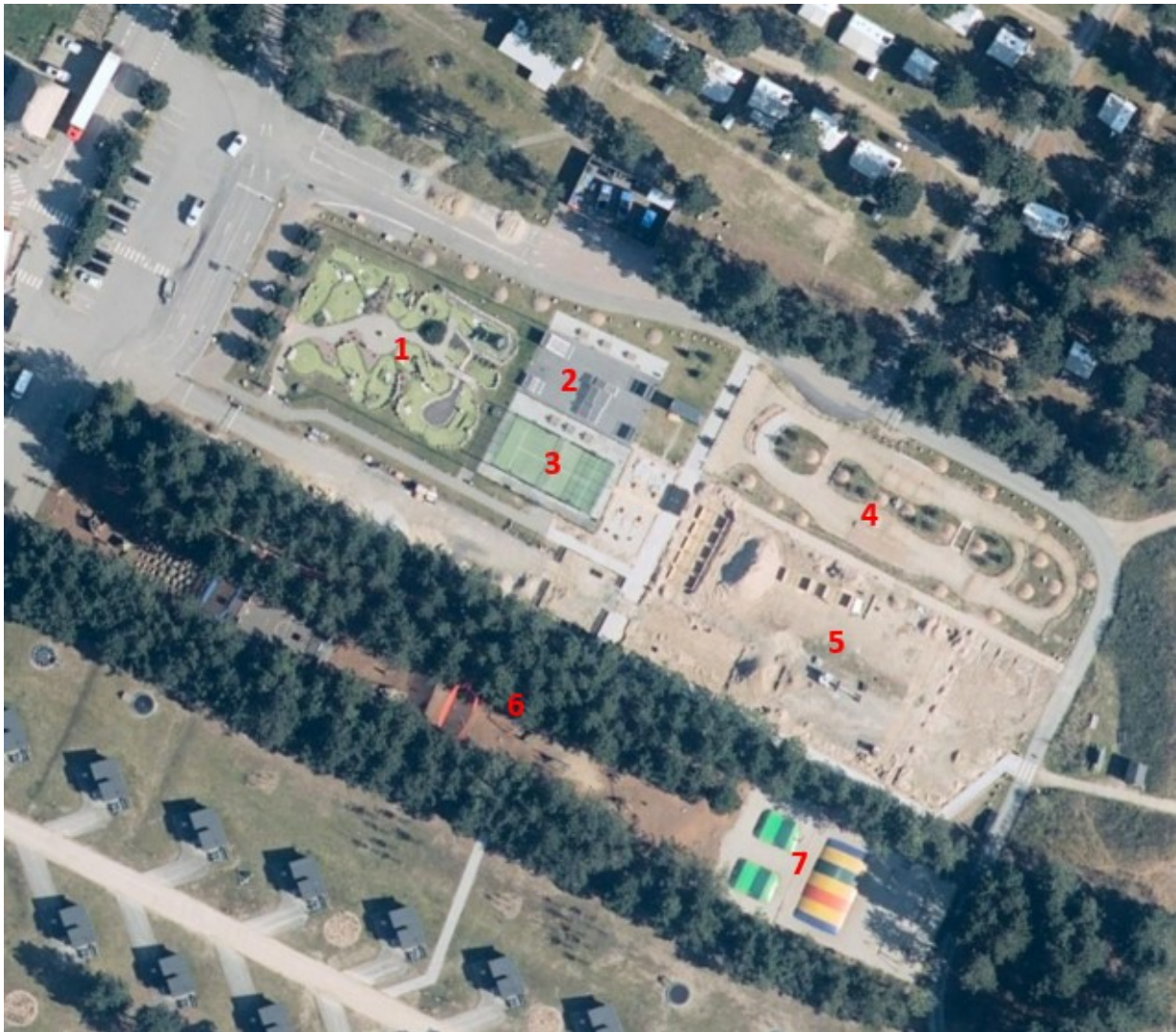
Foto fra 2023 viser minigolfbanen (1). Der er desuden anlagt skaterbane (2), padeltennisbane (3), bane for elbiler (4) og legeområde med fodboldbane, beachvolley, kælézoo mm (5), junglesti i træerne (6) og placeret hoppepuder mm. (7). Nord for projektområdet er der campingareal, og syd for projektområdet er der campinghytter.