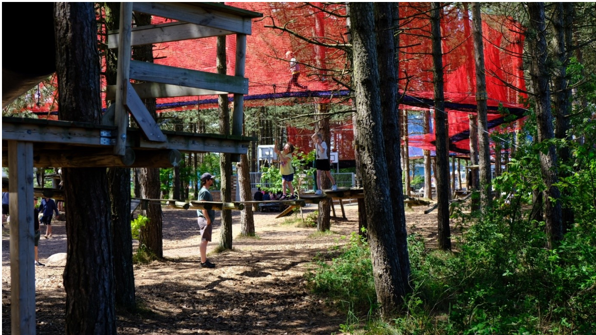
Foto fra terræn viser junglesti ophængt i træerne syd for den tidligere parkeringsplads.