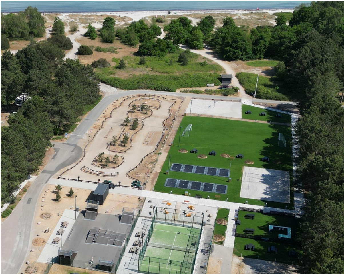
Foto fra vest viser padelbane, skaterbane, kæle zoo, beachvolley, trampoliner, fodboldbane, bane for elbiler m.m. Bygningerne længst mod øst, søværts vejen, er fjernet.