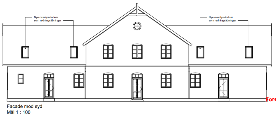
Figur 2 - Illustration af facade med nye ovenlysvinduer.

Bygningen er bevaringsværdig med en SAVE-værdi på 2.