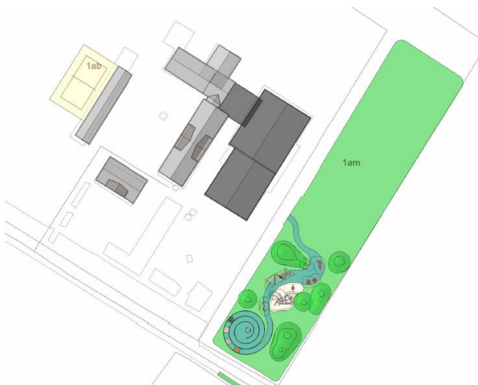
Figur 1: Område hvor legepladsen placeres i forhold til skolens areal.

Legepladsen etableres på den sydlige del af matrikel 1am. Spjellerup Friskole ønsker at skabe et grønt område med legeplads og beplantning, som imødekommer skolens vision om udeområder, der udvikler børns motoriske og mentale færdigheder. Legepladsens indretning vil være designet, så børnene naturligt udvikler sig gennem leg og interaktion med omgivelserne.