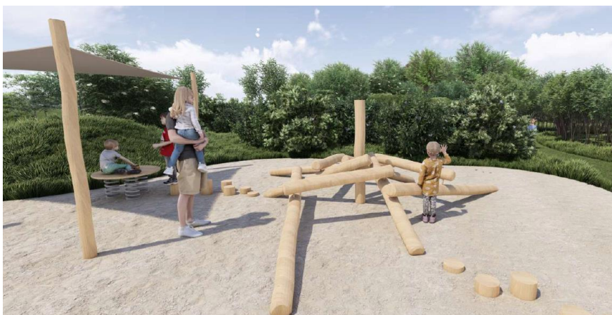
Figur 2: Eksempler på nogle af legeområderne med legeredskaber

Materialevalget til legeredskaberne vil primært være robinie- eller lærketræ. Alle legeredskaber vil overholde EN 1176, og hvis et legeredskab kræver faldunderlag, vil dette være et naturmateriale og CE-certificeret i henhold til EN 1177.