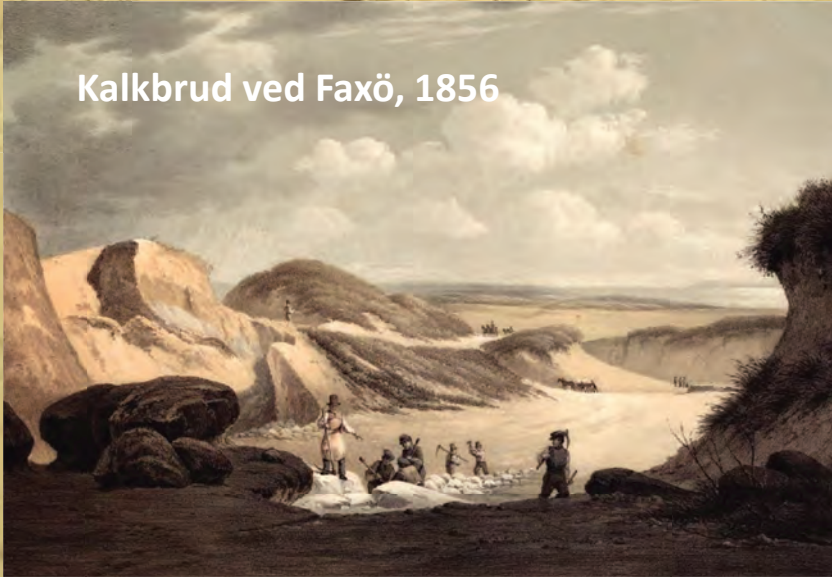
Kalkbrud ved Faxö, 1856