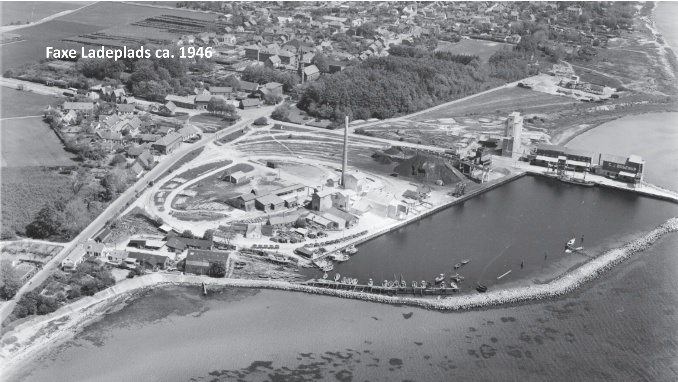
Faxe Ladeplads ca. 1946