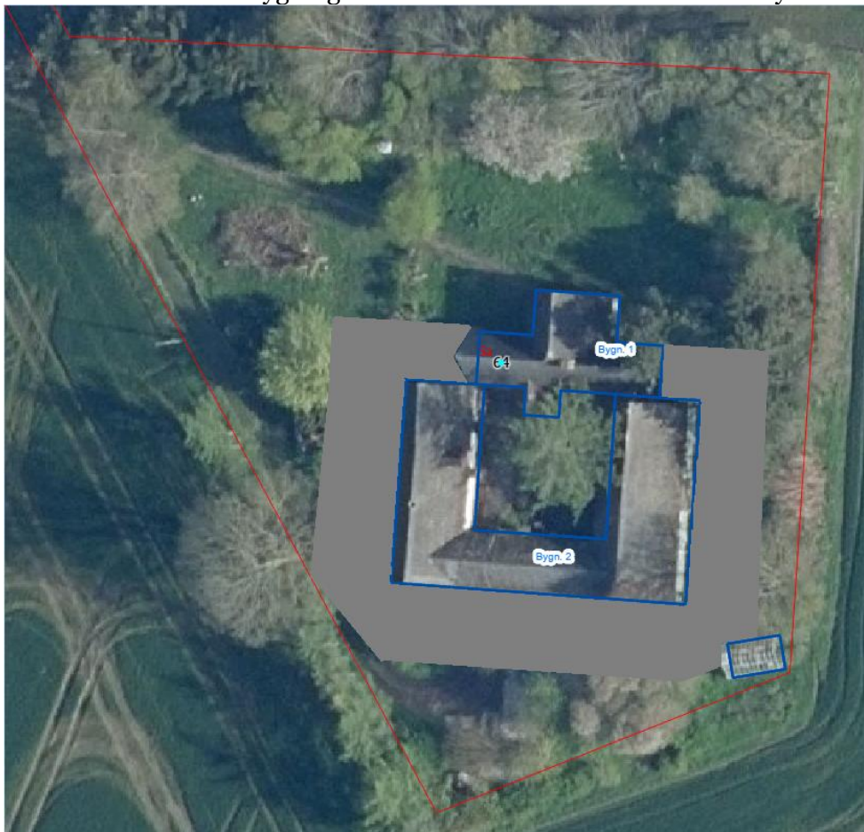
Figur 2: Den gråzone er arbejdes zone rundt om huset i en omkreds af fem meter. Tegningen er ikke mål fast.

Du har i ansøgningen oplyst, at der er behov for at konstruktionerne flyttes rundt alt efter behov i renoveringsprocessen. Der er derfor en arbejdszone seks meter rundt om bygningsmassen hvor konstruktionerne kan flyttes.