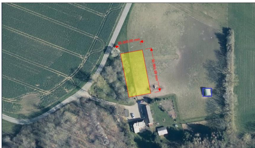
Figur 1: Omtrentlig placering af ridebanen med gult og læskuret markeret med blåt.

I forbindelse med sagsbehandlingen af ridebanen udstedes der også landzonetilladelse til allerede etableret 30 m 2 læskur på marken i østlige retning ca. 45 meter for den øvrige bygningsmasse.