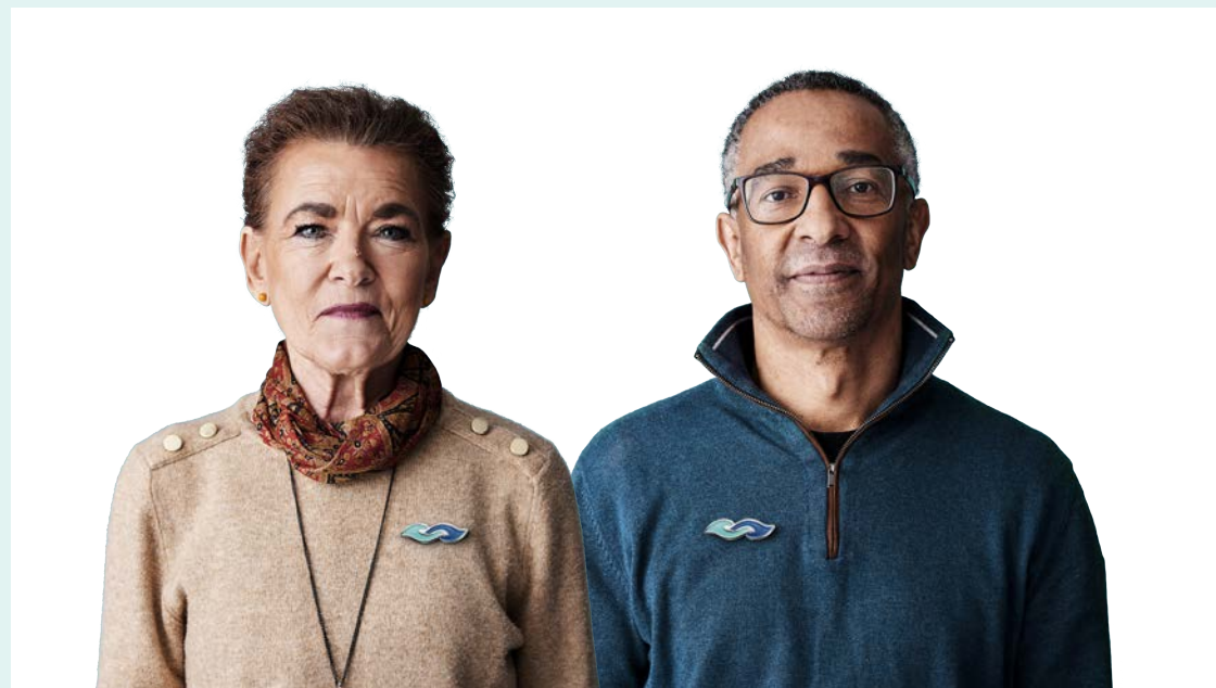
Ane, lever med demens