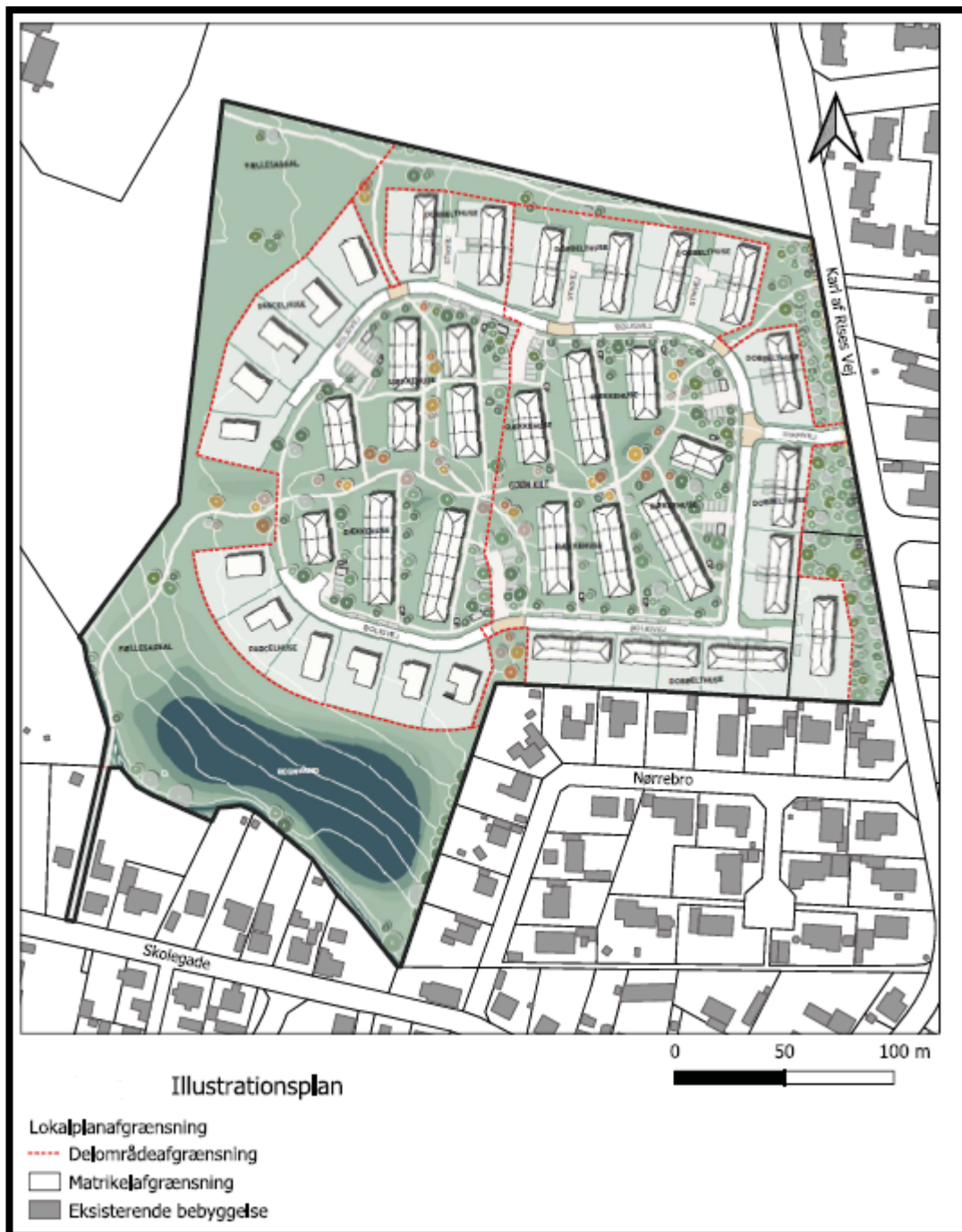
Kortbilag fra udkast til Lokalplan 200-30, Boligområde ved Karise Gårde